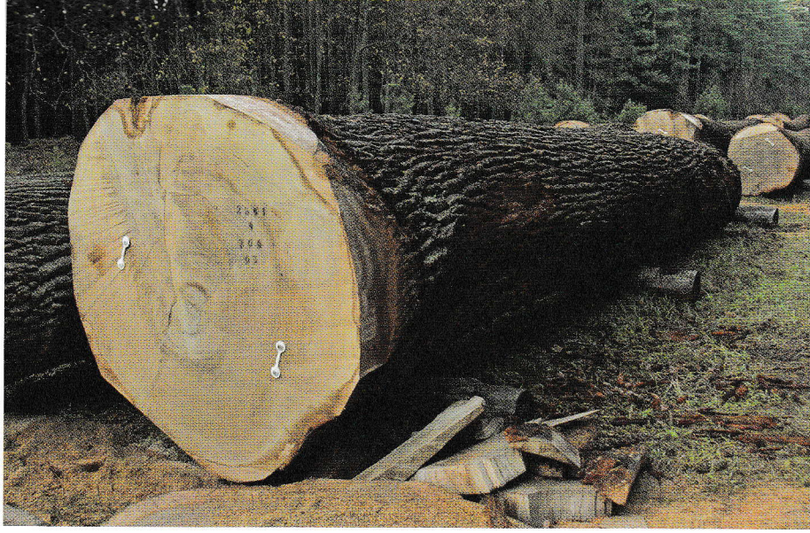
Dass Eichenstammholz den Hintergrund für sexistische Ausführungen liefert, ist nur schwer vorstellbar, kommt aber vor.

Traurig auch, dass sich keiner der Betreuer aus dem universitären Rahmen dazu berufen fühlte, hier einzugreifen. Dass dieser raue Ton aber auch an der Uni stattfindet, ist nichts Neues. Schon mehrere Male hatte ich bis dahin miterlebt, dass kranke oder frisch verheiratete Studentinnen von wissenschaftlichen Mitarbeitern als schwanger diffamiert wurden oder Kritik von Frauen als Hysterie oder Zyklusschwankung abgetan wurde. Würde man mit Kommilitoninnen sprechen, hätte jede von ihnen mindestens ein persönliches Beispiel auf Lager. Der ein oder andere Kommilitone mag da meinen »Ach warum, das ist doch nicht so tragisch«, »Sieh das doch nicht so ernst«, »Ja was willst du denn machen?« oder »Warum regt ihr Mädels euch nur immer so auf?«